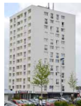
Tour Aubigné - Les Câlins

Coût de l'opération : 1 million d'euros HT soit 10 500 € HT / logement.