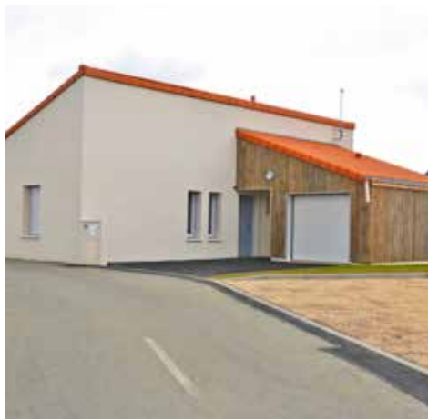
Les Bretonnais - Bégrolles en Mauges