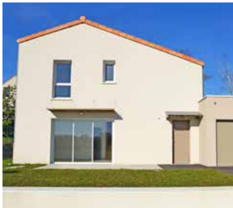
Le Hameau de la Fontaine - Jallais