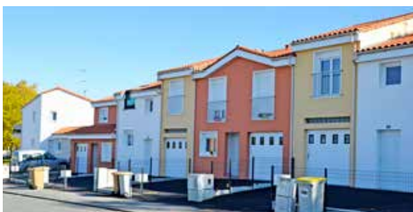
Le Hameau de la Maronnerie

Coût de l'opération : 1,088 million d'euros HT soit 17 000 € HT / logement.