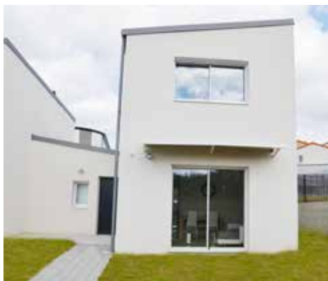
Val de Moine - Cholet